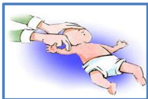
Fig. N° 1

Si no responde, coloque al niño en posición horizontal, con la cabeza hacia abajo y déle hasta 5 golpes con la mano plana entre los omóplatos (huesos triangulares de la espalda) (Fig.N°2)